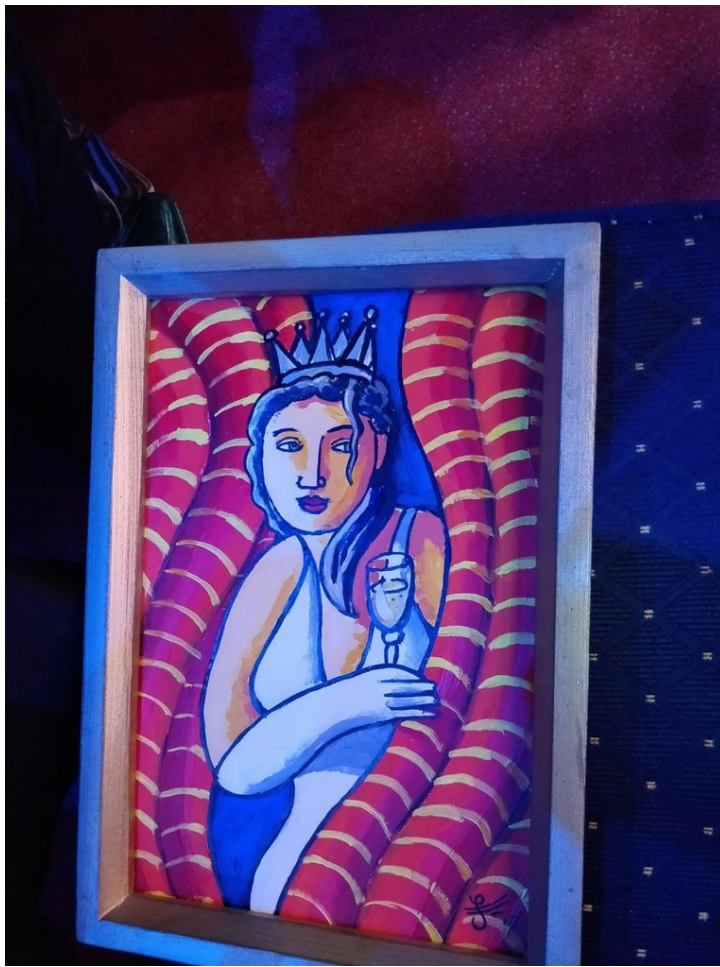
Tijdens de show verfdde de schilder het haar nog snel van blond naar bruin...