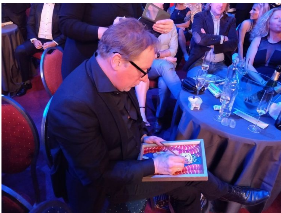
Het schilderij werd op maat gemaakt tijdens de uitzending.

Voor Angeline –die een lening van 100.000 euro aanging om haar pilotenopleiding te financieren- alvast een erg fraai extraatje.